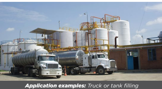
Application examples: Truck or tank filling